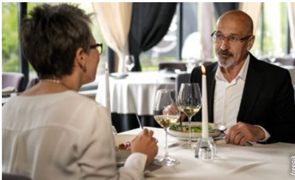
■ No safe level? Dem extremen Standpunkt der WHO steht eine Vielzahl von Studien gegenüber, die eine positive Wirkung von moderatem Alkoholkonsum belegen.