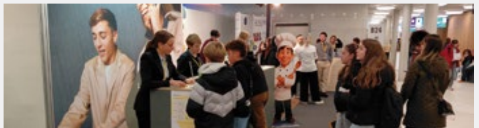
Der Stand des Gastgewerbes gehörte zu den beliebtesten Anlaufstellen der Messebesucher.

Das Basler Gastgewerbe war an der «Be-ruufsschau 2025» prominent vertreten. Der Stand hob die Vielfalt, Kreativität und Lei-denschaft der Branche hervor. Gemäss Zah-len der Hotel & Gastro formation Nordwest-schweiz haben im laufenden Jahr 192 junge Leute eine gastgewerbliche Berufsbildung in Basel-Stadt oder Baselland angefangen. Im Vorjahr waren es 199 neue Lehrverhältnisse.