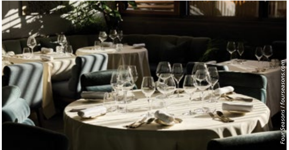
■ Leerbleibende Tische verursachen reale wirtschaftliche Schäden.

Viele Unternehmer berichten, dass Gäste diese Massnahmen überwiegend verstehen, wenn transparent kommuniziert wird, warum sie notwendig sind. «Es geht uns ja auch nicht um Sanktionen, sondern um Fairness und Verlässlichkeit», so Rothkopf.