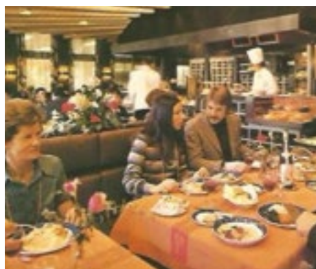
■ Bahnhofbuffet Bern in den 1980er Jahren: Die Gastronomie an Schweizer Bahnhöfen spiegelt den Wandel unserer Esskultur wider.

Als Gegenbewegung zur Globalisierung entsteht eine Sehnsucht nach Heimat: Regionale