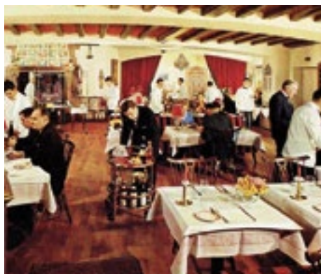
■ In der Rôtisserie La Grappe d'Or in Lausanne speist 1963 Sophie von Griechenland mit ihrem Verlobten Juan Carlos, dem späteren König von Spanien. Auch Rainier und Grace von Monaco sowie der Aga Khan lieben dieses elegante Lokal.

1989 bricht der Kommunismus zusammen, der Eisener Vorhang fällt, der Kalte Krieg endet. Am CERN in Genf wird das «World Wide Web» erfunden.