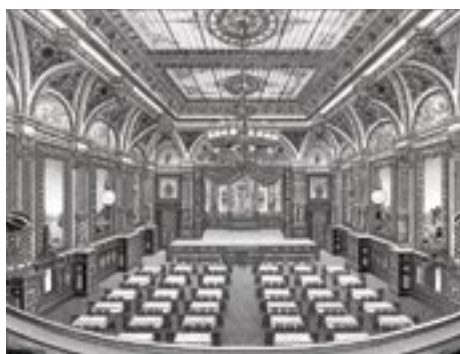
Das Variététheater «Cardinal» an der Freien Strasse bietet Platz für 400 Gäste. Die Aufnahme stammt vermutlich aus dem Jahr 1910. Zwei Jahre später wird das Haus in ein Kino umgebaut, das bis 1982 als «Alhambra» firmiert.

Der Erste Weltkrieg stürzt das Gastgewerbe in eine tiefe Krise. Internationale Reisende und Kurgäste bleiben aus. Die Aufnahme verwun-