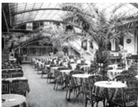
Der «Storchen» ist um die Jahrhundertwende das erste Haus am Platze. Das Sonntagsmenü kostet drei Franken, was etwa drei Tageslöhnen eines Knechts entspricht. Der Palmen-Wintergarten dient als Kaffeehaus und Konzerthalle.