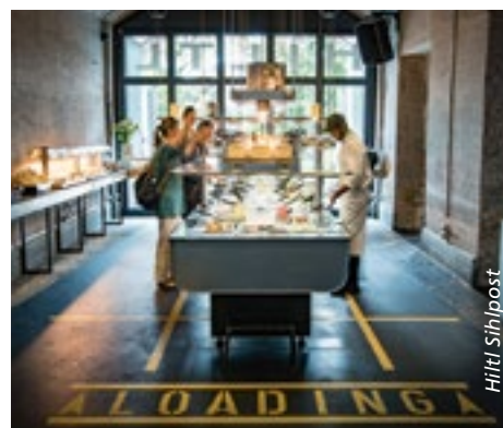
■ Buffet-Systeme wie hier im Hiltl Sihlpost ermöglichen Gästen, selbst zu wählen, was und wie viel sie essen wollen. Ethische, ökologische und gesundheitliche Motive führen dazu, dass die Nachfrage nach pflanzenbasierten Gerichten zunimmt.