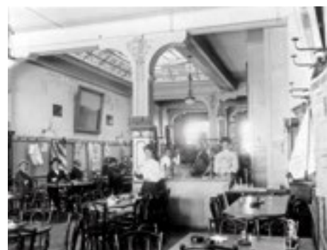
Männer mit Hut, Basler Löwenbräu und Nationalzeitung: Das Bild aus dem Jahr 1905 zeigt die «Gambrinushalle» an der Falknerstrasse, die im Volksmund liebevoll «Gampiross» genannt wird. Es gibt Musik und Darbietungen aller Art.