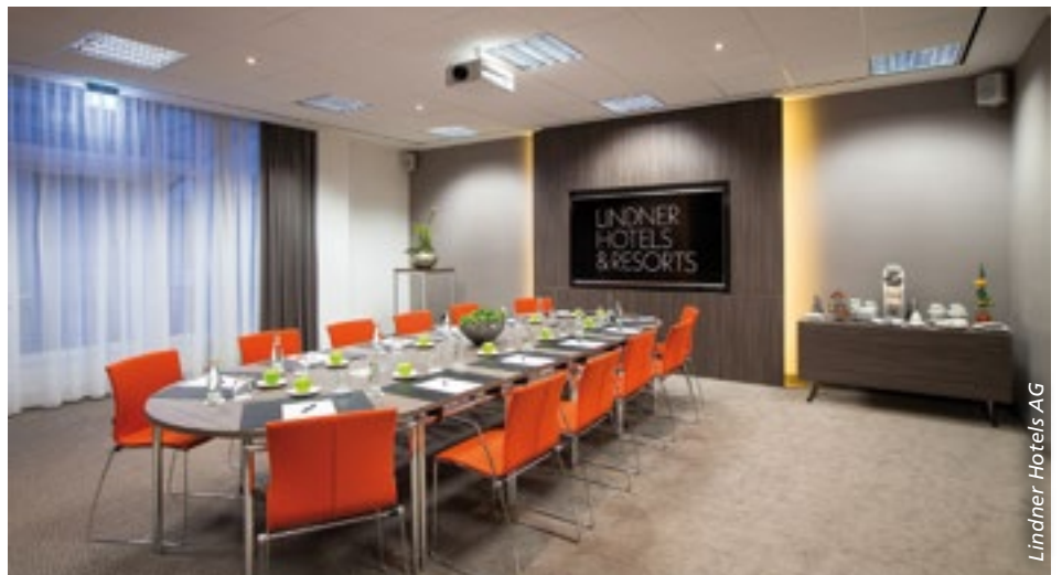
■ Die Veranstalter von Meetings und Kongressen werden anspruchsvoller.

Nachhaltigkeit als Erlebnisfaktor. 79 Prozent der Veranstalter bevorzugen Anbieter mit zertifizierten Standards. Es braucht Konzepte, die bewusst, ressourcenschonend und erlebbar sind, z.B. mit regionaler Küche, kurzen Wegen und transparenten Prozessen.