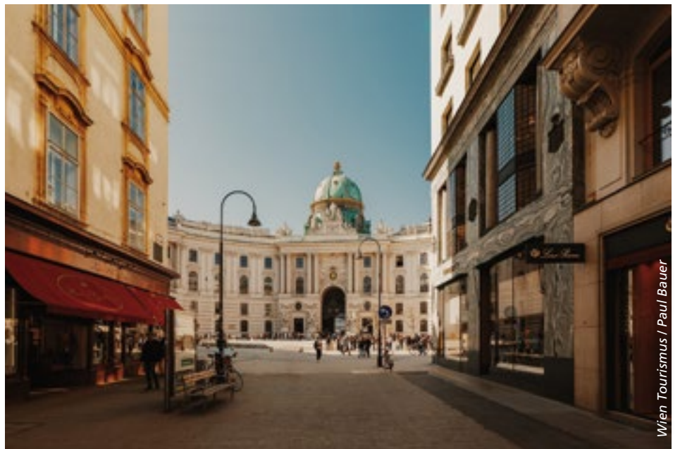
■ Hofburg und Michaelerplatz: Wien zieht auch wegen seiner imperialen Vergangenheit viele Touristen an.

Als besondere Stärke in der weltweiten Akquise erweist sich der «Vienna Meeting Fund»: Mit einem Fördervolumen von 8.7 Millionen Euro unterstützt er Veranstalter von Kongressen und Meetings seit 2021, wenn sie Wien als Standort wählen. Seit der Erstauflage wurden über 1300 Förderanträge eingereicht, die Veranstaltungen bis ins Jahr 2028 abdecken. Rund 900 Förderungen wurden bisher zugesagt.