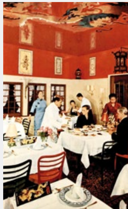
Das China-Restaurant Golden Dragon im Hotel Touring & Red Ox an der Ochsengasse in Basel (um 1970).

gibt es erstmals 1989 im «Edo» (heute Taverne Johann). Zu jener Zeit gehen am Rheinknie auch die ersten Thai-Lokale auf, das (alte) «Sukhothai» in Binningen und das «Dream Café» in der St. Alban-Vorstadt. Und mit dem «Tapadera» das erste mexikanische Restaurant der Stadt.