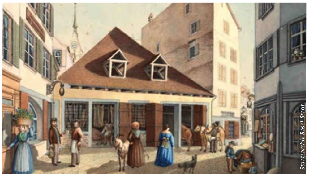
Die Speisewirtschaft Seb. Burckhardt an der Sattलगasse 12 in Basel, rechts daneben der «Wurstwinkel» mit dem Schlachthaus, die Speisewirtschaft J.J. Fuchs und ein Durchblick zum Marktplatz (1861).

Im 18. Jahrhundert setzen sich individuelle Gastzimmer durch. Es gibt bereits zahlreiche «Motschenken» mit eigener Presse und «Bierschenken» mit Brauereien, doch noch trinken die meisten Schweizer lieber Wein. weiter auf Seite 2