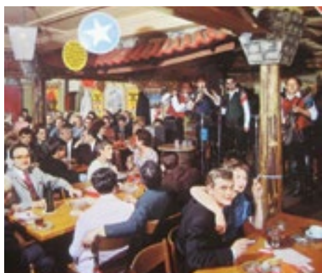
■ Die Bierhalle Wolf im Niederdorf hat eine lange Geschichte. Nach einer Umgestaltung eröffnet sie 1980 neu, um bürgerliche Küche mit Unterhaltungsmusik zu verbinden – ein Konzept, das bis heute besteht.

In den 2010er Jahren wird der «Burger» zum neuen Schnitzel. Ursprünglich ein Imbissangebot, ist er nun in allen Segmenten anzutreffen, auch in Gourmetversionen.