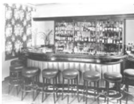
■ Sunny-Bar im ersten Stock des Restaurants Baselstab (1960). Lange verfügen nur einige mondäne Grand-Hotels über Theken mit Barhockern. Bei uns setzt sich das Format erst nach dem Zweiten Weltkrieg durch.