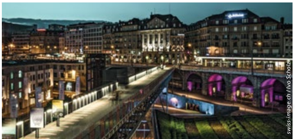
■ Das Quartier Flon im Herzen von Lausanne.

Darüber hinaus räumt die Stadt den Lebensmittelgeschäften die Möglichkeit ein, Terrassen einzurichten. Die Gebühren für Terrassen von Gastronomiebetrieben wurden um 13% gesenkt. Floristen dürfen den öffentlichen Raum vor ihrem Geschäft sogar kostenlos nutzen.