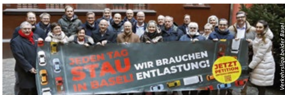
Verkehrsliga beider Basel

Mit Beginn der Sanierungen auf der Osttangente haben sich die Stautunden in der Region nochmals vervielfacht. Der Transit-, Pendler- und innerstädtische Verkehr staut sich täglich auf den Hauptachsen und verstopft Quartiere, Nebenstrassen und ganze Gemeinden. Die grossen Verbände der beiden Basel sind sich einig, dass es dringend Lösungen braucht. Gemeinsam haben sie eine Petition mit über 2100 Unterschriften eingereicht, damit die Kantone sich endlich für spürbare Entlastung engagieren.