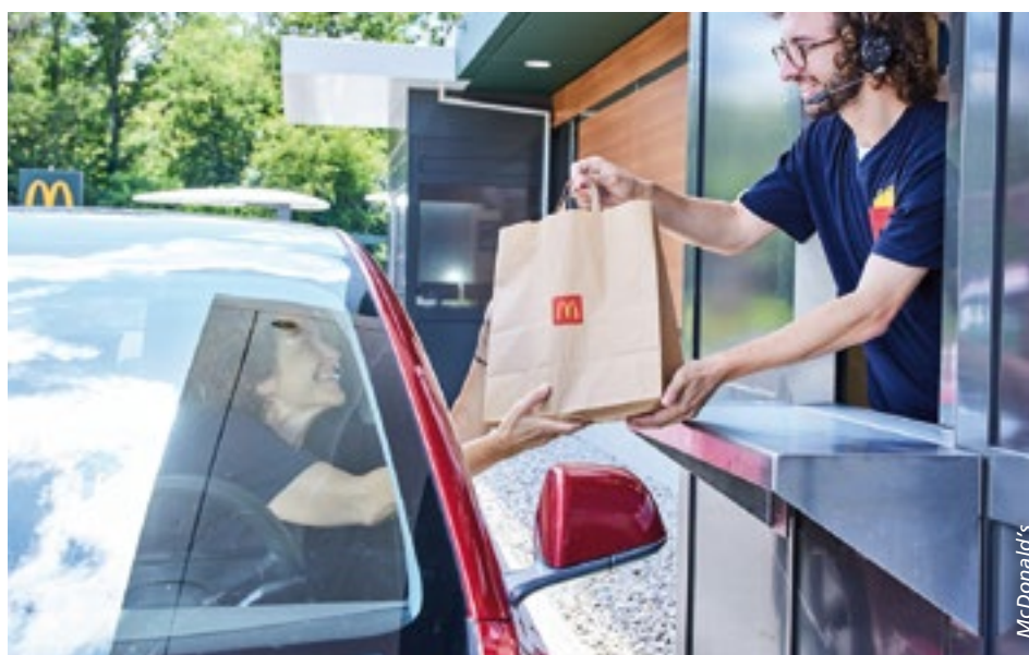
■ Alternative Vertriebskanäle wie Take-Away, Delivery und Drive-Thru gewinnen Marktanteile. Die Kunden bestellen per App oder an Self-Ordering-Terminals. KI-Systeme sorgen dafür, dass Bestellungen per Chatbot angenommen werden können.

Die Kunden bestellen digital vor, konfigurieren ihre Speisen individuell, holen sie ab oder lassen sie sich liefern. Beim Verzehr vor Ort setzt sich Self-Ordering via Terminals, Apps oder QR-Code durch. Nur satt werden ist auf Dauer