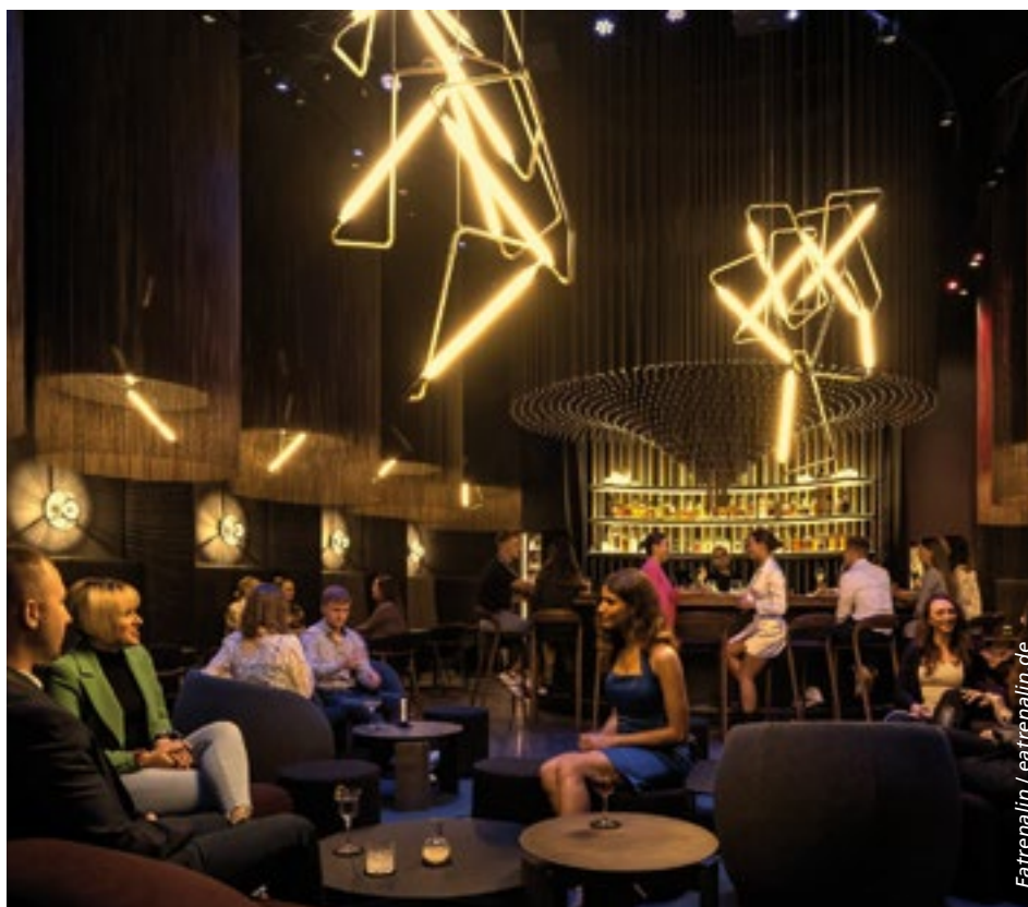
Das Abendessen bleibt erlebnisorientiert. Zur Inszenierung gehören auch die Beleuchtung, die Akustik, das Raumgefühl und Multimedia-Elemente.