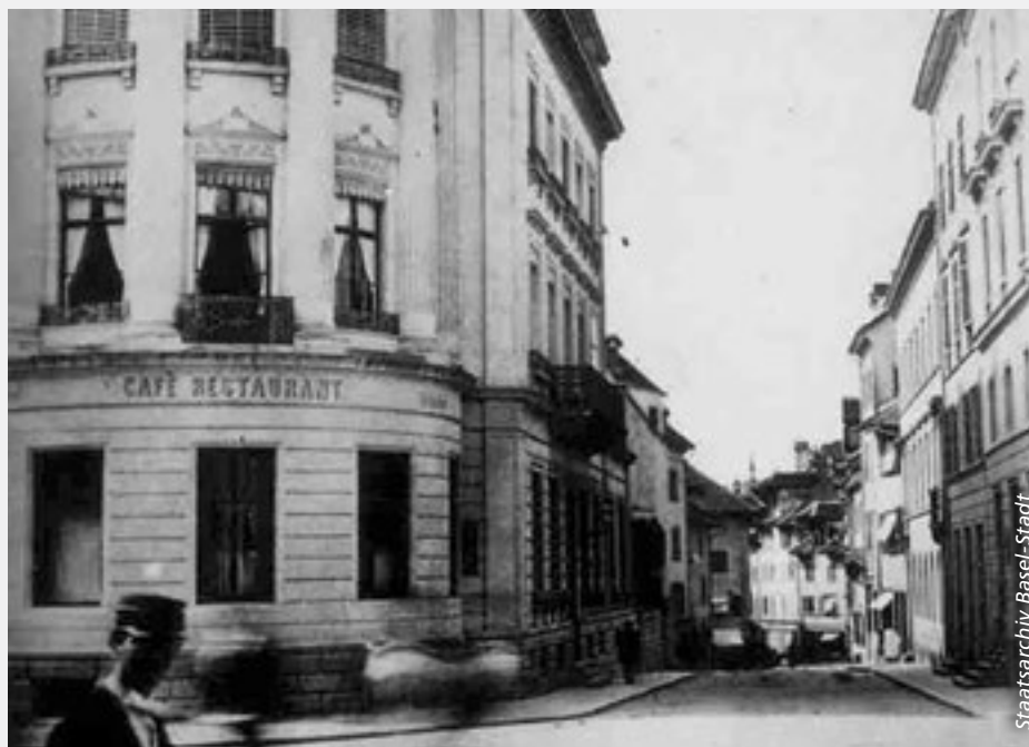
Das Café Restaurant Schilthof an der Freien Strasse (um 1860).

die ein sofortiger Erfolg wurde. 1859 eröffnet Sprüngli ein zweites Geschäft am Paradeplatz.