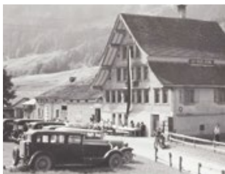
■ Mit dem Automobil ins Grüne: Das Gasthaus Krone in Brülisau AI in den späten 1930er-Jahren. Ein Vierteljahrhundert später entsteht in der Nähe die Talstation der Luftseilbahn zum Hohen Kasten.