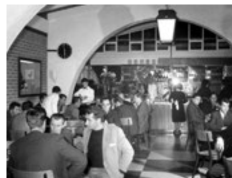
■ Der Bierkeller an der Ochseneggasse läuft ausgesprochen gut. Der Gerstensaft fliesst in Strömen, doch kommt es immer wieder zu Keilereien. Manchmal fliegen nicht nur Gläser und Stühle von der Empore, sondern auch Gäste. Bild aus dem Jahr 1962.