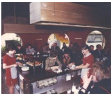
■ Runde Sitznischen: Das «Silberkugel»-Konzept von Mövenpick orientiert sich stark an amerikanischen Fast-Food-Ketten und bietet preiswerte Schnellgerichte für ein breites Publikum.

1974 wird ein erster Landes-Gesamtarbeitsvertrag für das Gastgewerbe ausgehandelt und