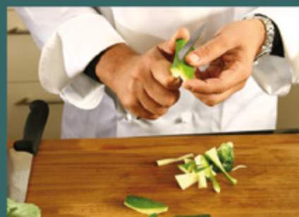
Stellenangebote und Stellengesuche