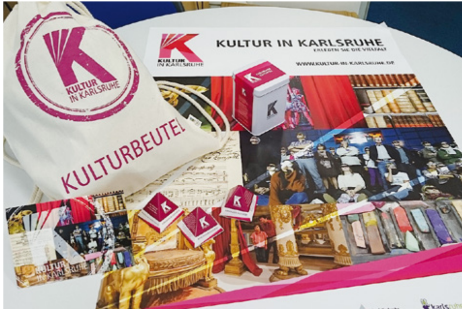
Mit Auftritten auf Reisemessen sowie gemeinsamen Print- und Online-Produkten und Merchandise-Artikeln werben die Partner der Kampagne für die Kulturstadt Karlsruhe.

Hinter der Kampagne «Kultur in Karlsruhe» steht die Arbeitsgemeinschaft Kulturmarketing, die aus dem Kulturbüro der Stadt, der Stadtmarketing Karlsruhe GmbH und der KTG Karlsruhe Tourismus GmbH besteht und gemeinsam mit den Kulturpartnern die neue Marke etabliert.