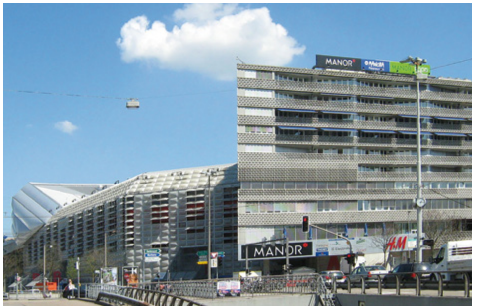
Die Depotpflicht im Gebiet des St. Jakobs-Parks stellt zahlreiche Anbieter im Einkaufszentrum vor grosse Herausforderungen.

Die Verordnung läuft auf eine neue indirekte Steuer hinaus. Die Betriebe bezahlen schon heute Entsorgungsgebühren und sie müssen ihren Abfall trennen. Die Verordnung bevorteilt Unternehmen im nahegelegenen Kanton Baselland, wo man keine solchen Vorschriften kennt, sowie Anbieter ausserhalb des Perimeters. Ob der Grosse Rat sich bewusst war, was er mit dem beschlossenen «Massnahmenpaket für eine verbesserte Sauberkeit und zur Abfallvermeidung in Basel» anrichtet?