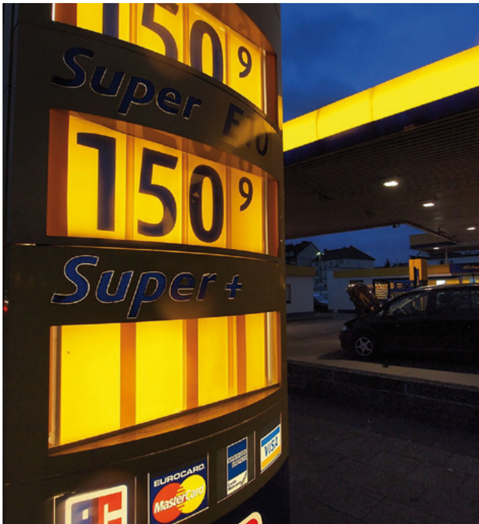
Tiefere Benzinpreise sorgen für mehr Geld in den Portemonnaies der Konsumenten.

Für den Ausserhaus-Konsum haben US-Amerikaner innert zwölf Monaten 2.9 Prozent mehr ausgegeben, während der Aufwand für den Heimkonsum im gleichen Zeitraum nur um 0.8 Prozent zunahm. Für die Verschiebungen gibt es noch andere Gründe, zum Beispiel die Inflation, einen Anstieg der Reallöhne und eine höhere Beschäftigungsquote.