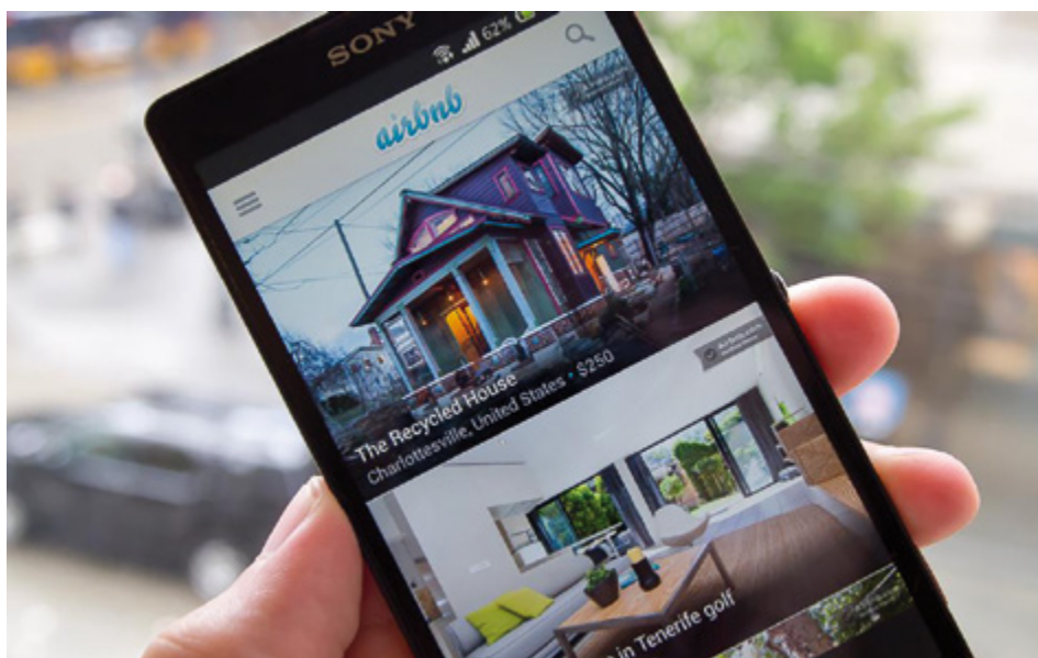
■ Die «Sharing Economy» hat sich von ihrer Ursprungsidee entfernt. Die schleichende Industrialisierung von Kurzzeit-Vermietungen ist eine Tatsache.

Die Zahl der durch Airbnb generierten Nächtigungen beläuft sich weltweit auf rund 100 Millionen. Das Walliser Tourismus-Observatorium schätzt, dass in der Schweiz durch Airbnb dieses Jahr mindestens eine Million Logiernächte angefallen sind. Nimmt man den Durchschnittspreis von 80 Franken pro Nacht und Bett, kommt man auf rund 80 Millionen Franken Jahresumsatz.