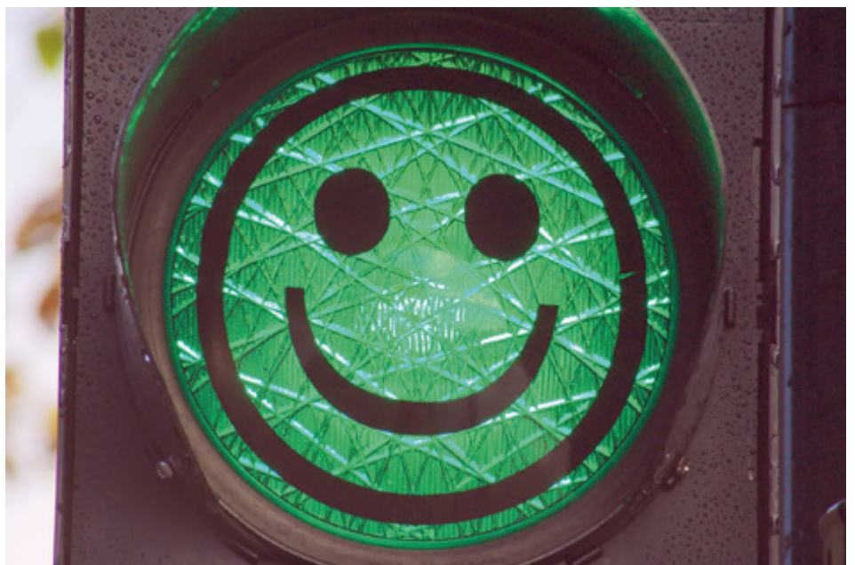
■ Die Stimmbürger haben die Extremforderungen der VCS-Strasseninitiative durchschaut.

Eine leistungsfähige Verkehrsinfrastruktur und genügend Parkplätze sind nicht nur für die Bevölkerung, sondern insbesondere auch für die KMU wichtig. Nur so können diese ihre Dienstleistung in der erwarteten Qualität erbringen. Der schleichen- de Parkplatzabbau muss aufhören.