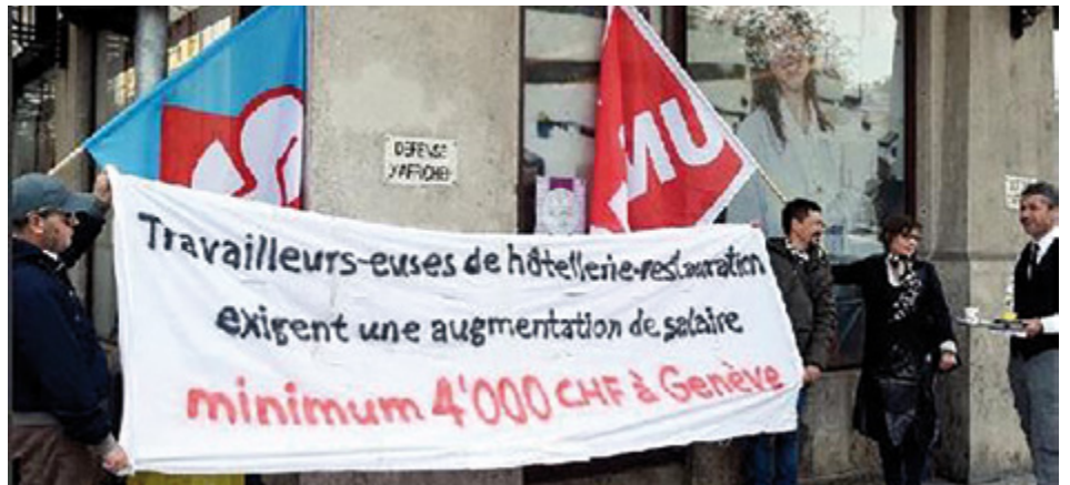
Die Protestaktion vor den Büros des Genfer Wirtverbandes verstösst gegen die Friedenspflicht.

Bei der Unia ist ein Import von Arbeitskämpfmethode aus gewissen Nachbarländern zu beobachten. Dieses Verhalten widerspricht dem schweizerischen Modell einer Sozialpartnerschaft, welche gewillt ist, Anliegen vernünftig am Verhandlungstisch und ohne öffentlichen Schlagabtausch auszutarieren.