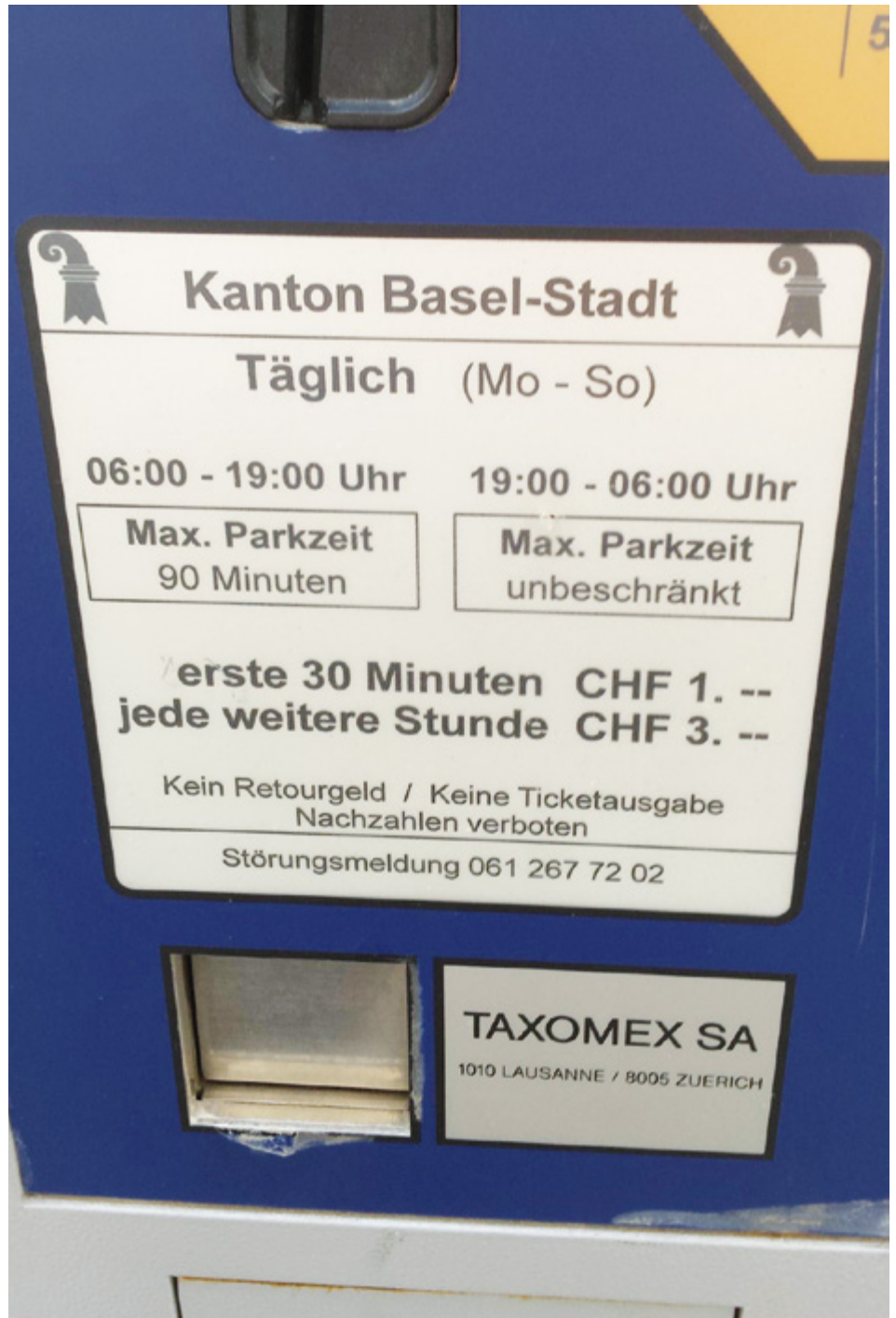
3 Franken pro Stunde in der Nacht: Basel schwebt in einsamen Tarifsphären.