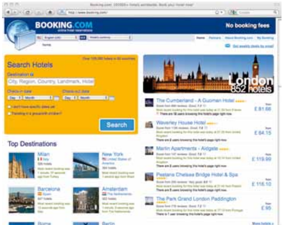
Die Macht grosser Buchungsplattformen stellt für den Hotelmarkt eine Bedrohung dar.