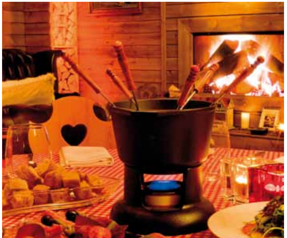
■ Die Sehnsucht nach handgefertigtem Essen, nach Bodenständigem und Traditionellem sowie nach Gemeinschaft und Ritualen wächst.

Während die Konsumenten dem Discount eine düstere Zukunft prophezeien, sind ihre Erwartungen für das zweite dominierende Einzelhandelsformat, den Supermarkt, weit positiver. Kein Wunder, experimentieren doch verschiedene Supermärkte mit neuen Konzepten. Nähe, Intimität, Unmittelbarkeit Weiter auf der nächsten Seite