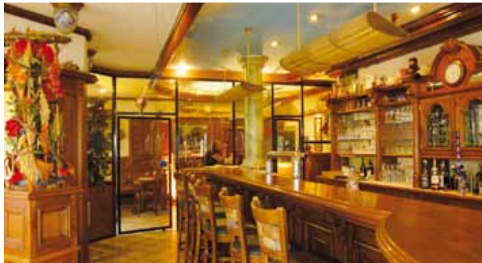
Bei Raucherbetrieben handelt es sich ausschliesslich um Kleinstlokale, bei Fumoirs stets um Nebengebiete.

Das scheint auf den ersten Blick wenig. Doch bei