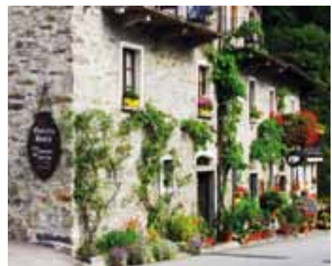
■ Die Restaurants im Tessin kommen glimpflich davon. Weit stärker leiden Bars und Diskotheken unter dem Rauchverbot.