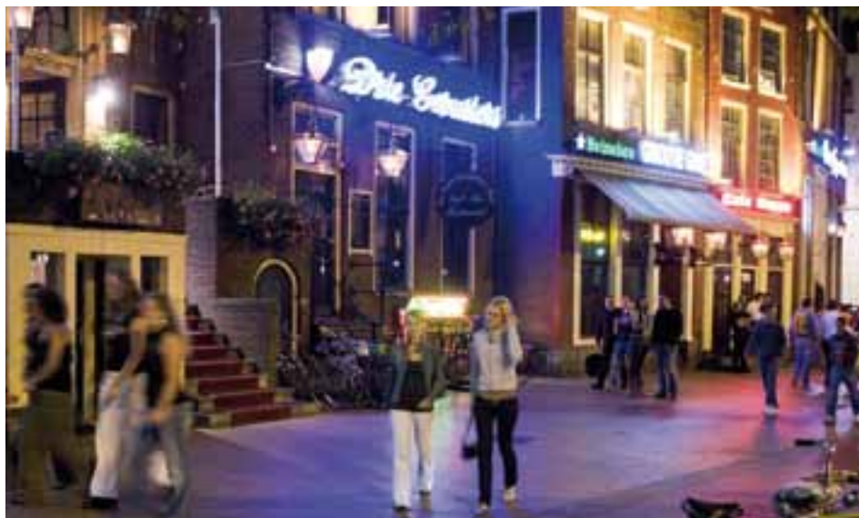
■ In den Niederlanden, in Kroatien und in Bulgarien wurden kürzlich Rauchverbote wieder gelockert.

In Italien, Polen und anderen Ländern ist die Bedienung von Fumoirs zugelassen. Davon ist in den Medien leider nie die Rede. Und schliesslich gibt es noch Staaten wie Spanien oder Griechenland: Dort gibt es zwar Anti-Raucher-Gesetze, doch werden diese mehr oder weniger offen ignoriert. Durchsetzungsprobleme, wenn auch geringeren Ausmasses, sind auch in anderen Ländern bekannt.