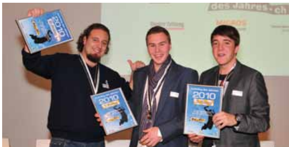
■ Nach dem «Koch des Jahres» hat das Grand Hotel Les Trois Rois nun auch noch den «Lehrling des Jahres»!