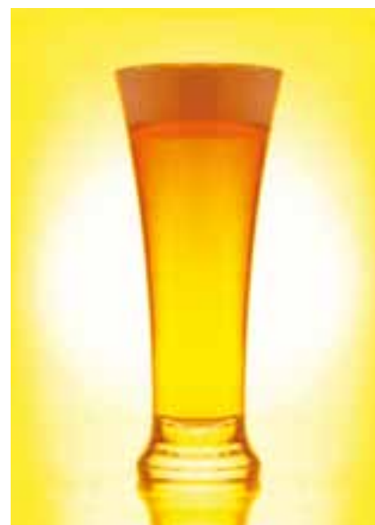
■ Die Stange Bier schlägt vielerorts um 10 bis 20 Rappen auf.

Weil die Ertragslage in der Branche nach wie vor angespannt ist, besteht kein Spielraum, Mehraufwand den Gästen nicht weiter zu geben. Essen und Trinken im Restaurant ist – gemessen an der Kaufkraft – in den letzten Jahrzehnten günstiger geworden. Der Verband beobachtet, dass die Unterschiede zwischen den Betrieben weiter zunehmen.