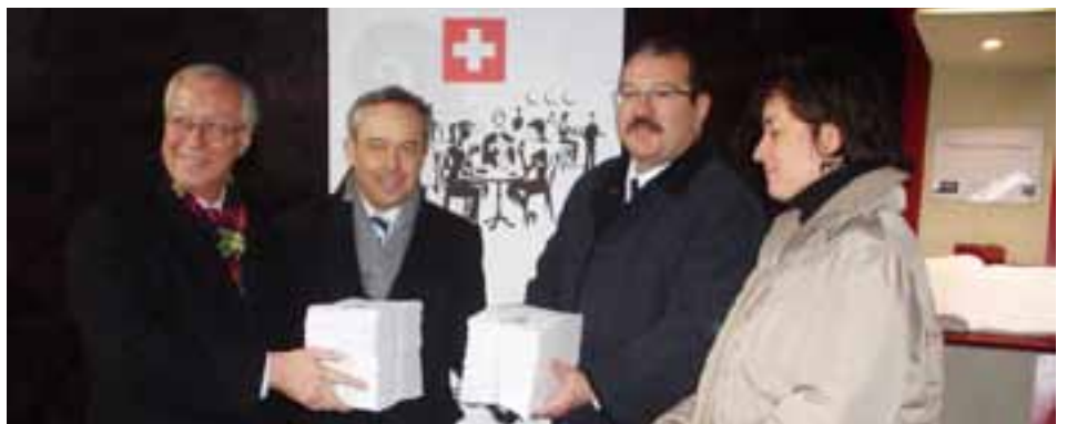
■ 6021 beglaubigte Unterschriften: Hochgerechnet auf die Schweiz entspricht das 250'000 Unterschriften!