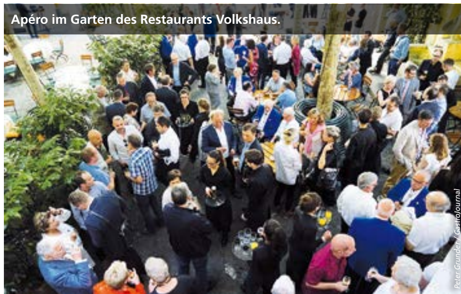
Apéro im Garten des Restaurants Volkshaus.

Der Grosse Rat sprach sich im Rahmen der Revision des Übertretungsstrafrechts für eine Nachruhe ab 23 Uhr aus, zu allen Wochentagen und Jahreszeiten. Basel ist die erste grosse Schweizer Stadt mit einer solchen Regelung. Statistisch gesehen, hat sich der durchschnittliche Einschlafzeitpunkt der Bevölkerung in den letzten Jahrzehnten um eine Stunde nach hinten verschoben.