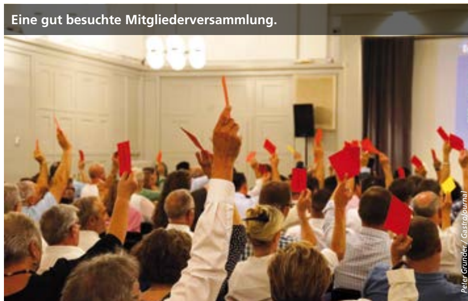
Eine gut besuchte Mitgliederversammlung.

Erfolgreiche Gastronomen konzentrieren sich stark darauf, wie sie auf den Mobiltelefonen ihrer potentiellen Kunden erscheinen, sind jene doch oft unterwegs und entscheiden kurzfristig. Mit Geo-Targeting ist standortbezogene Werbung möglich. Durch eine starke Eingrenzung des Werbegebiets und der Werbezeiten können Mittel effizient eingesetzt werden.